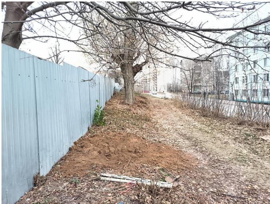
Рис. 11. Шурф № 1. После рекультивации.