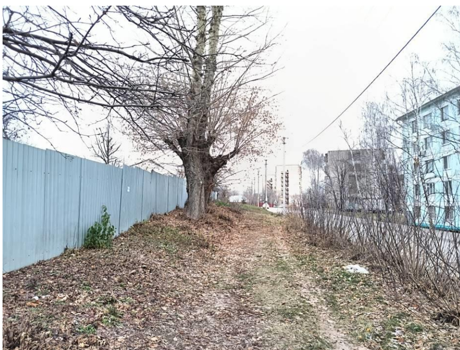
Рис. 6. Типичный ландшафт территории проведения исследований. Общий вид с юга на район расположения восточной части участка объекта: «Жилой комплекс со встроенными нежилыми помещениями и подземной автостоянкой по адресу: ул. Годовикова». Точка фотофиксации №2.