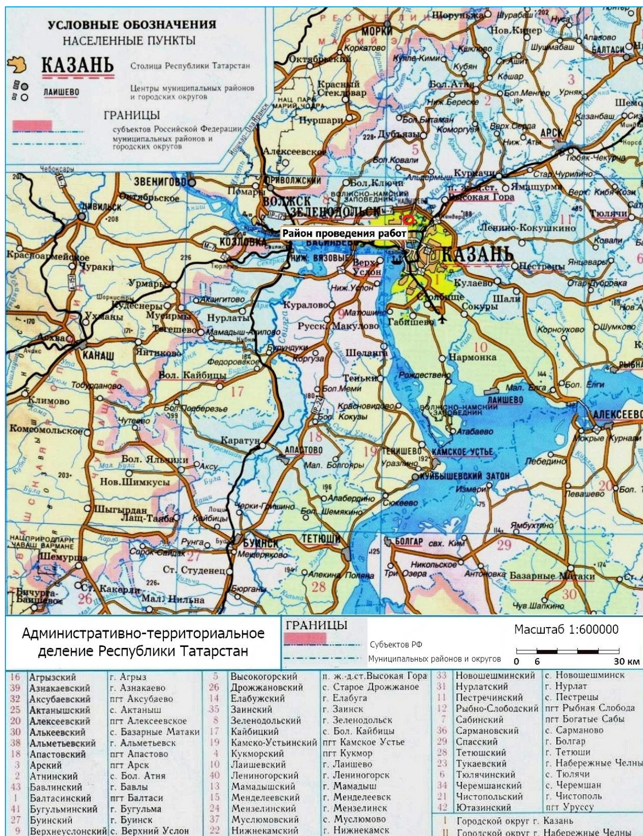
Рис. 1. Район работ по объекту: «Жилой комплекс со встроенными нежилыми помещениями и подземной автостоянкой по адресу: ул. Годовикова» в городском округе Казань (№ I) РТ.