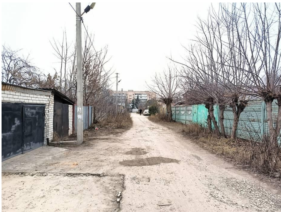
Рис. 5. Типичный ландшафт территории проведения исследований. Общий вид с юга на район расположения западной части участка объекта: «Жилой комплекс со встроенными нежилыми помещениями и подземной автостоянкой по адресу: ул. Годовикова». Точка фотофиксации №1.