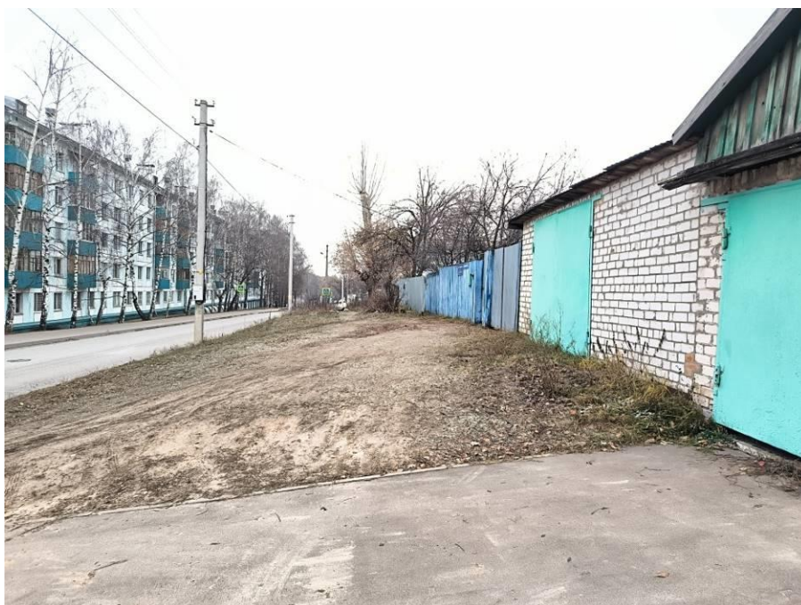
Рис. 7. Типичный ландшафт территории проведения исследований. Общий вид с севера на район расположения восточной части участка объекта: «Жилой комплекс со встроенными нежилыми помещениями и подземной автостоянкой по адресу: ул. Годовикова». Точка фотофиксации №3.