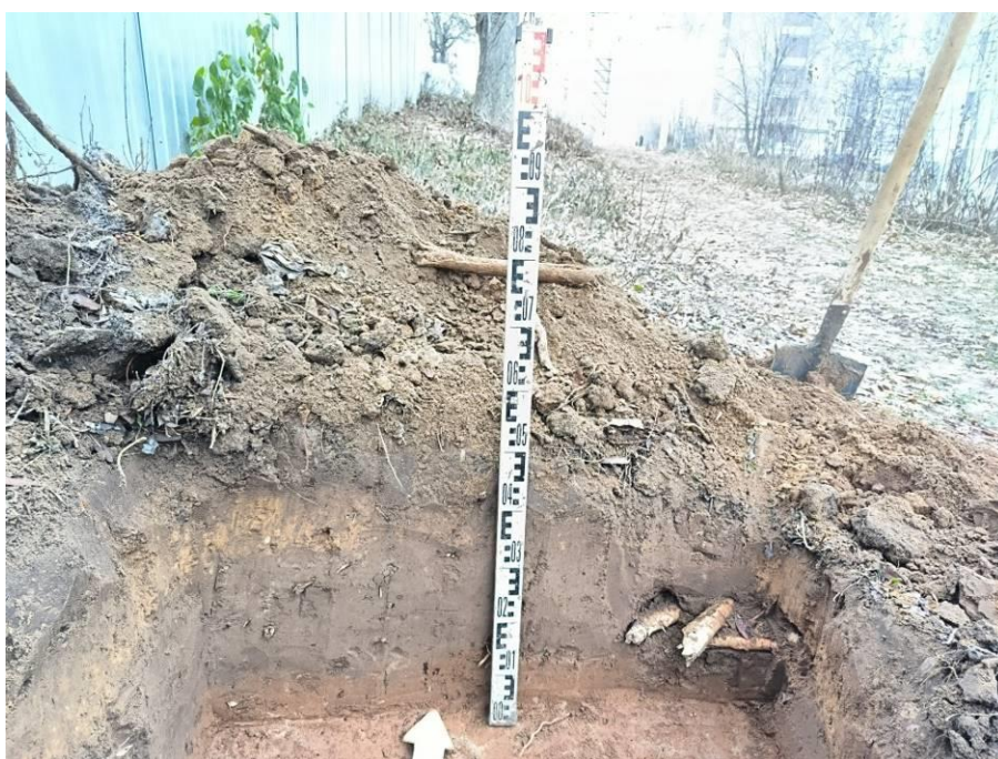
Рис. 9. Шурф № 1. Северная стенка.