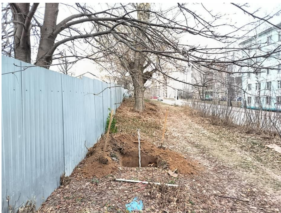
Рис. 10. Шурф № 1. По завершении работ.