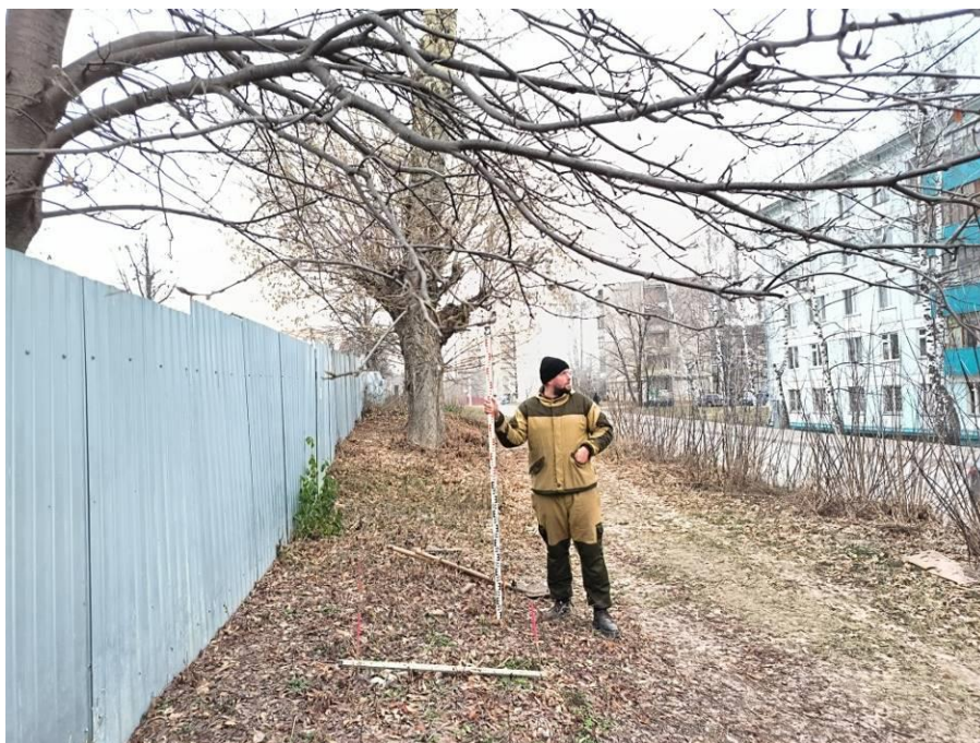
Рис. 8. Шурф № 1. Место заложения и район расположения площадки объекта, на задернованной водораздельной поверхности. Вид с юга.